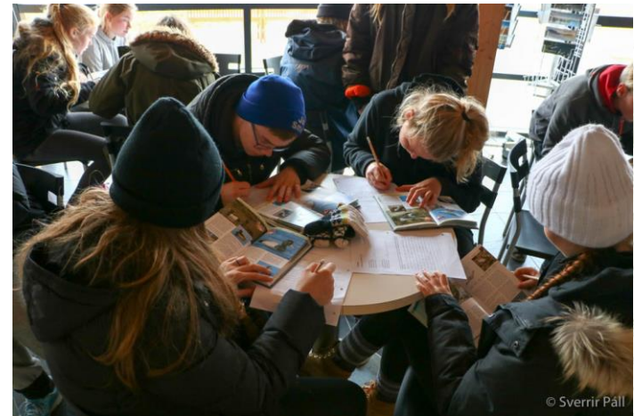
Á Fuglasafninu í Mývatnssveit, 2016