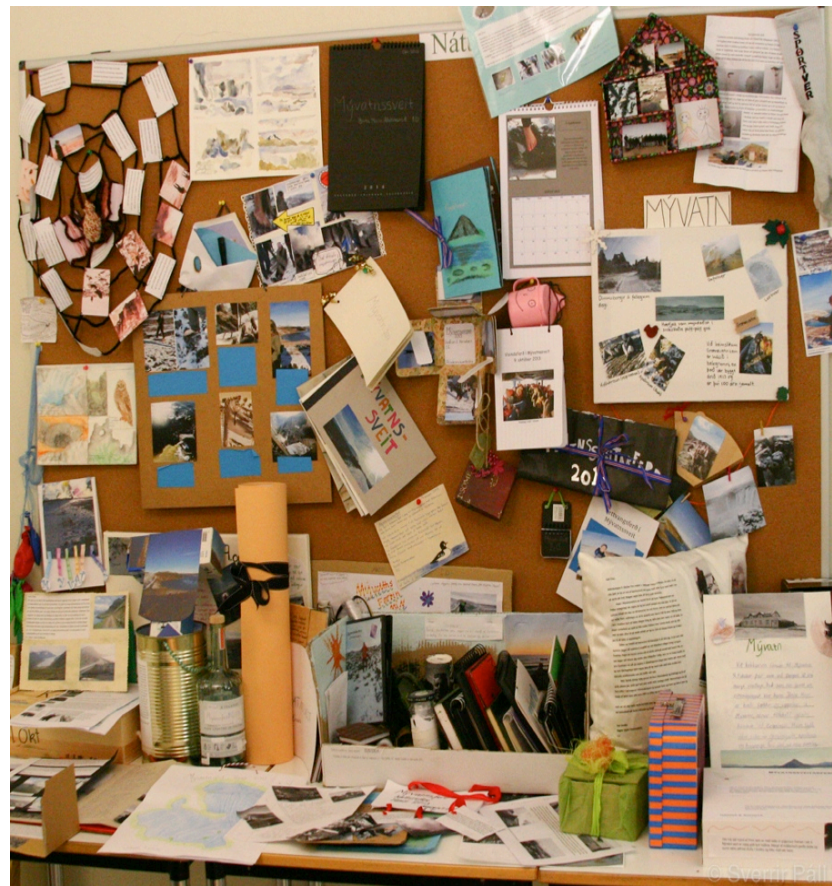
Verkefni úr Mývatnssveitarferð í náttúrulæsi