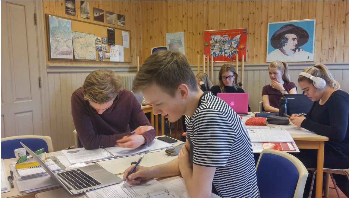
Bókmenntatími á hraðlínu, vor 2017