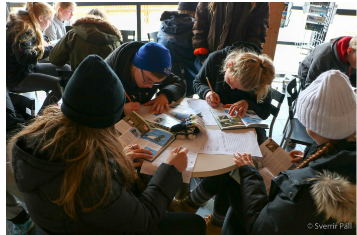
Á Fuglasafninu í Mývatnssveit, 2016