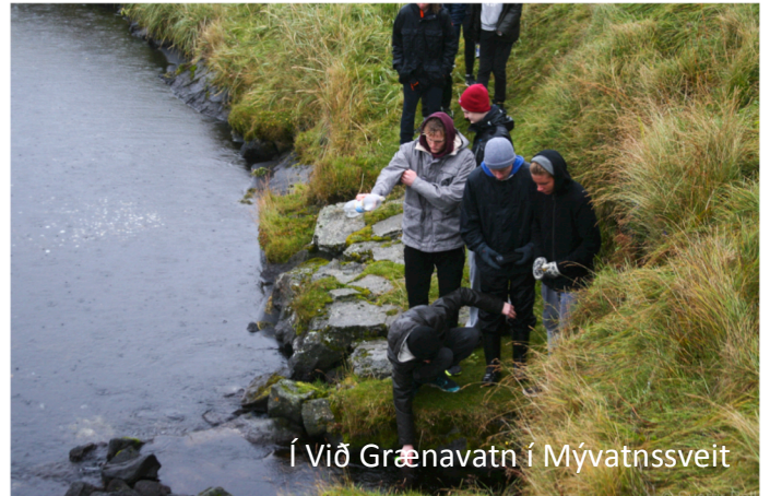
Í Við Grænavatn í Mývatnssveit

Fjöldmargir kennarar fóru á dögum á ráðstefnu um rannsóknir og þróunarstarf í framhaldsskólum. Þar voru kynntar fyrstu niðurstöður mjög viðamikillar rannsóknar um framhaldsskóla en gögnum var safnað í níu skólum sl. vetur.