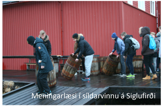
Meningarlæsi í síldarvinnu á Siglufirði

Á inna.is má fylgjast með mætingum nemenda, sjá miðannarmat sem birt er fyrstu helgina í nóvember og lokaeinkunnir í áföngum að loknum próftíðum í janúar og maí/júní.