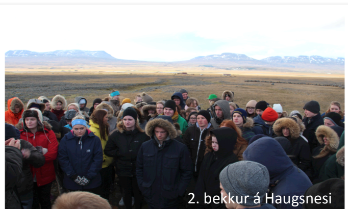
2. bekkur á Haugsnesi

Hægt er að biðja um leyfi hjá skólameistara eða aðstoðarskólameistara. Fjarvistir vegna leyfa lækka mætingaprósentuna en ef nemandi mætir að öðru leyti vel og sinnir náminu af kappi er tillit tekið til þessa. Nemandi ber þó alltaf ábyrgð á því sjálfur að ræða við kennara ef til dæmis próf, hópvinna eða önnur verkefnaskil lenda á leyfisögum.