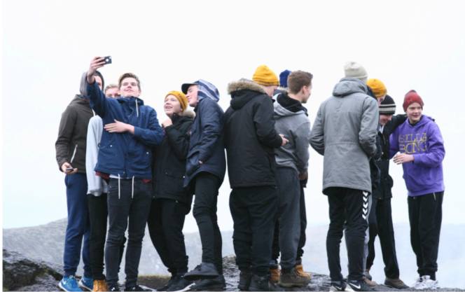
Náttúrulæsi við Goðafoss

Tilkynna þarf veikindin á hefðbundinn hátt og senda viðkomandi kennara póst auk þess sem nemandinn þarf að ræða við kennarann strax og hann kemur aftur í skólann eftir veikindi. Ekki eru sjúkrapróf vegna allra símatsprófa. Nánar í kennsluáætlunum áfanganna.