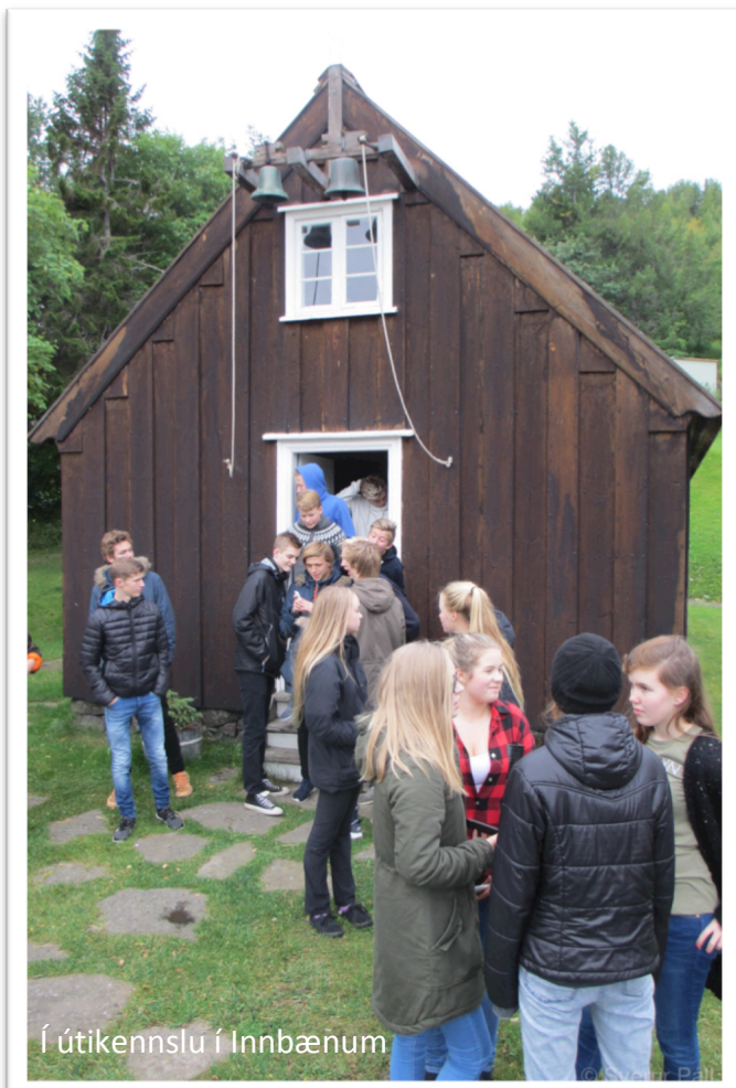
Í útikennslu í Innbænum

Þriðjubekkingar, sem reka sjoppu í frímínútum, hafa í vetur leitast við að hafa á boðstólum hollustufæði og dregið úr sælgætisúrvalinu. Mikill fjöldi nemenda borðar reglulega í Mötuneyti MA og með hverju árinu fer fjölgandi þeim bæjarnemendum sem kaupa sér fast fæði í hádeginu alla skóladagana.